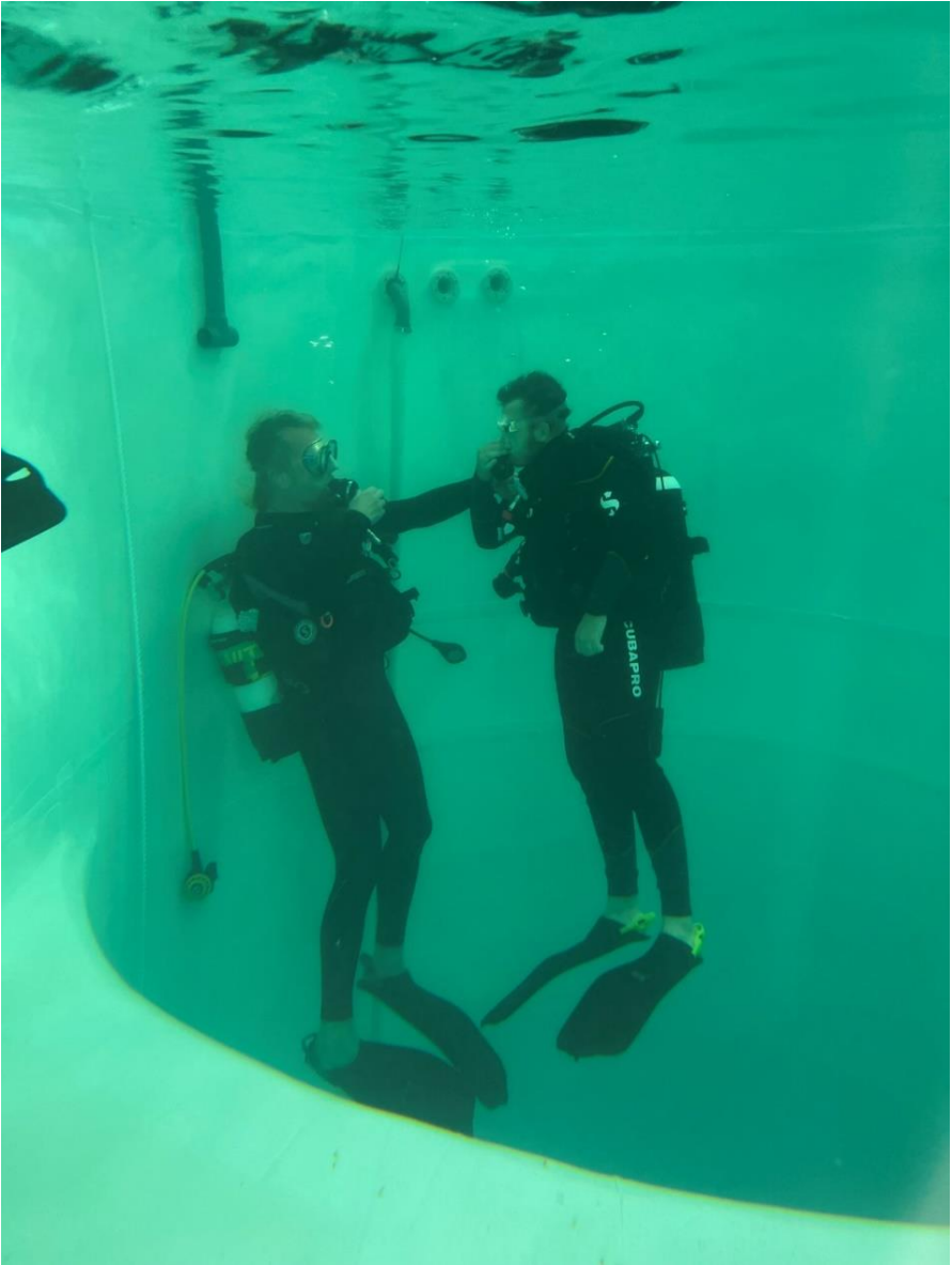
Baptême de plongée